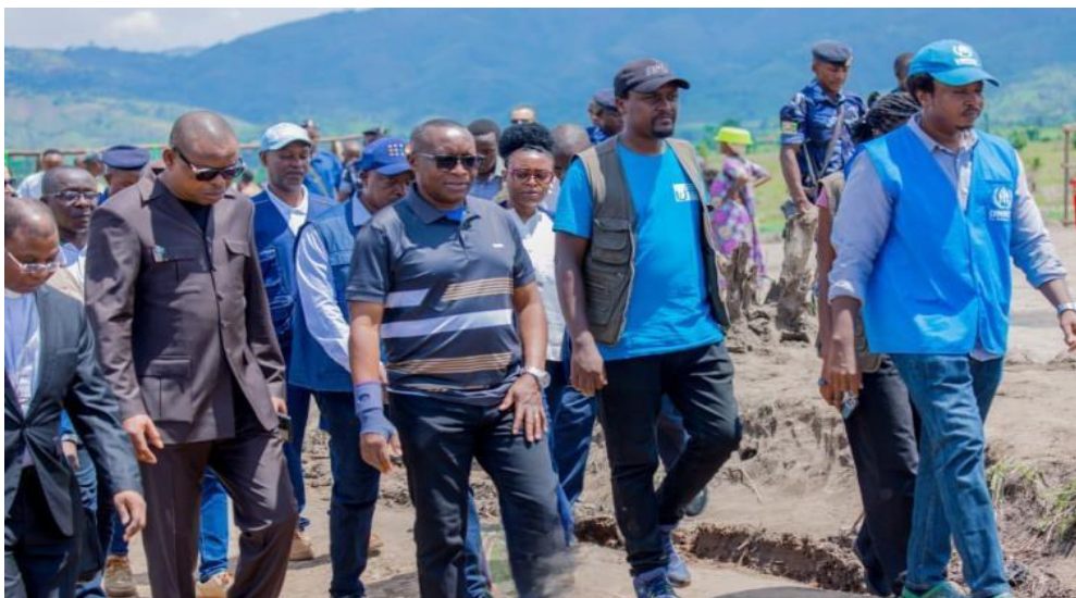
Arrivée du ministre Amb. Bizimana Edouard au site de transit de Kansega

manent au Ministère des Affaires étrangères Séverin Mbarubukeye a reçu une délégation des Ambassadeurs de l'Union Européenne (Belgique, France, Royaume-Uni, Pays-Bas et Allemagne) pour discuter de la situation humanitaire à l'Est de la RDC et des attaques du M23 soutenu par le Rwanda. Les ambassadeurs ont salué l'accueil burundais et confirmé l'engagement de l'Union Européenne à soutenir les réfugiés.