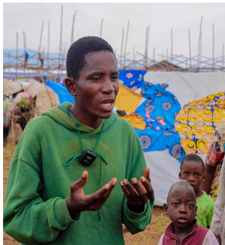
Rescapé d'une attaque à la bombe

«Nous dormions, moi, mon épouse et notre enfant quand, soudain, nous avons été réveillés par un grand bruit. Au départ nous croyions que quelqu'un venait de défoncer la porte. Nous sommes alors sortis pour voir ce qui se passait, et c'est là que des bombes nous sont tombées dessus. J'ai été projeté par l'explosion et j'ai perdu connaissance. Quand j'ai repris connaissance, ma femme enceinte et mon enfant gisaient par terre, tués par l'explosion».