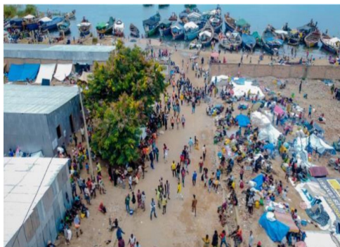
Débarquement de réfugiés à Rumonge en province de Burunga