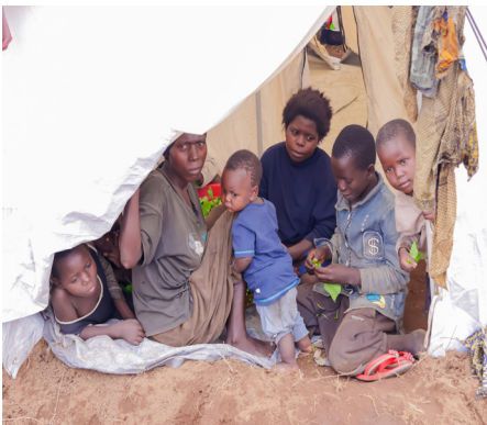
Réfugiés en attente d'une aide d'urgence

fugiés eux-mêmes que pour le Burundi, et appelle une intervention humanitaire urgente et coordonnée afin de répondre efficacement aux besoins immédiats et de restaurer la dignité des populations affectées.