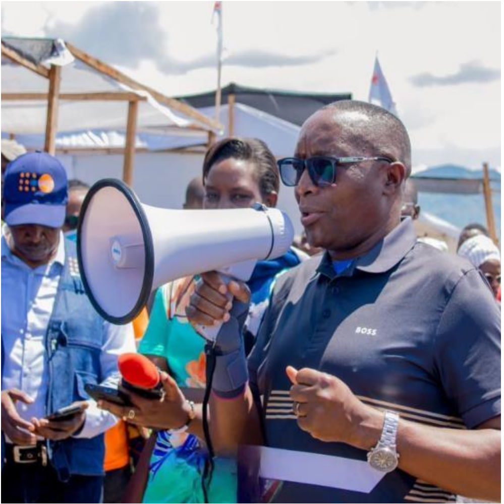
Le ministre Amb. Bizimana Edouard s'adresse aux réfugiés congolais

Quoique la commune de Bukinanyana avait déployé d'importants moyens pour accueillir les réfugiés congolais malgré des moyens financiers très limités, il a été jugé bon que les réfugiés sur place soient transférés à Bu-