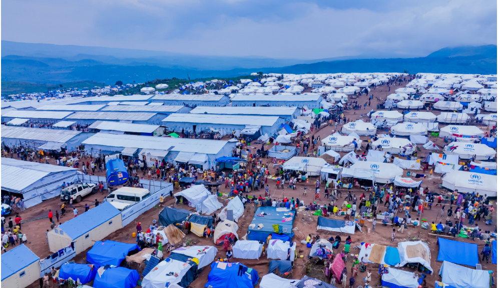
Vues aériennes du site de Busuma en commune Ruyigi, province Buhumuza