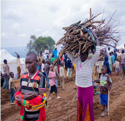
Réfugiée transportant du bois de chauffe au site de Busuma

et une dépendance importante à l'agriculture de subsistance. Dans ce contexte, l'arrivée massive et soudaine de réfugiés exerce une pression considérable sur les capacités nationales d'accueil et de prise en charge.