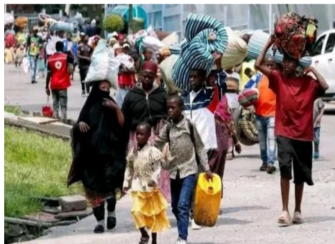
Réfugiés cherchant un lieu pour s'installer à Rumonge en province de Burunga

Face à cette insécurité persistante, des dizaines de milliers de Congolais ont traversé la frontière burundaise dans des conditions extrêmement précaires, cherchant refuge et protection. Ces réfugiés n'ont presque rien pu emporter avec eux et étaient dans l'obligation de vivre dans des conditions extrêmement difficiles, sans nourriture, sans eau, sans médica-