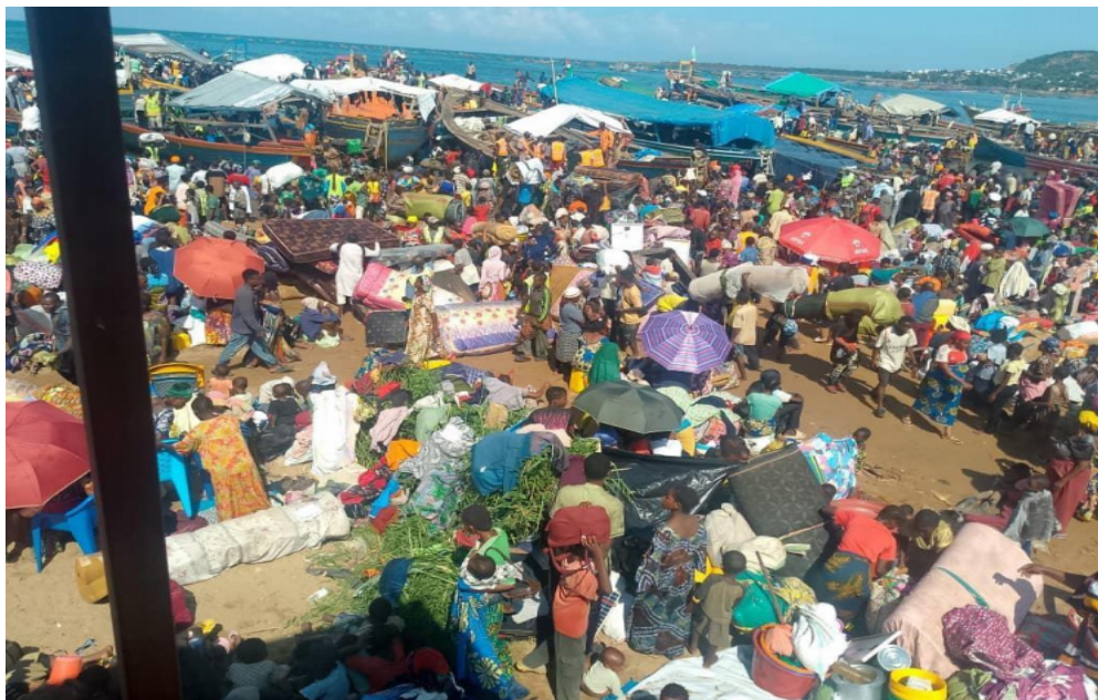
Réfugiés entassés au bord du lac Tanganyika à Rumonge en province de Burunga

ments, sans latrines,... Des élèves ont dû abandonner leurs études, ce qui sans doute va compromettre leur avenir, au moment où les adultes ont dû abandonner leurs emplois. Toutes ces personnes vivent actuellement dans une incertitude et une détresse totale ne sachant pas l'avenir qui les attend.