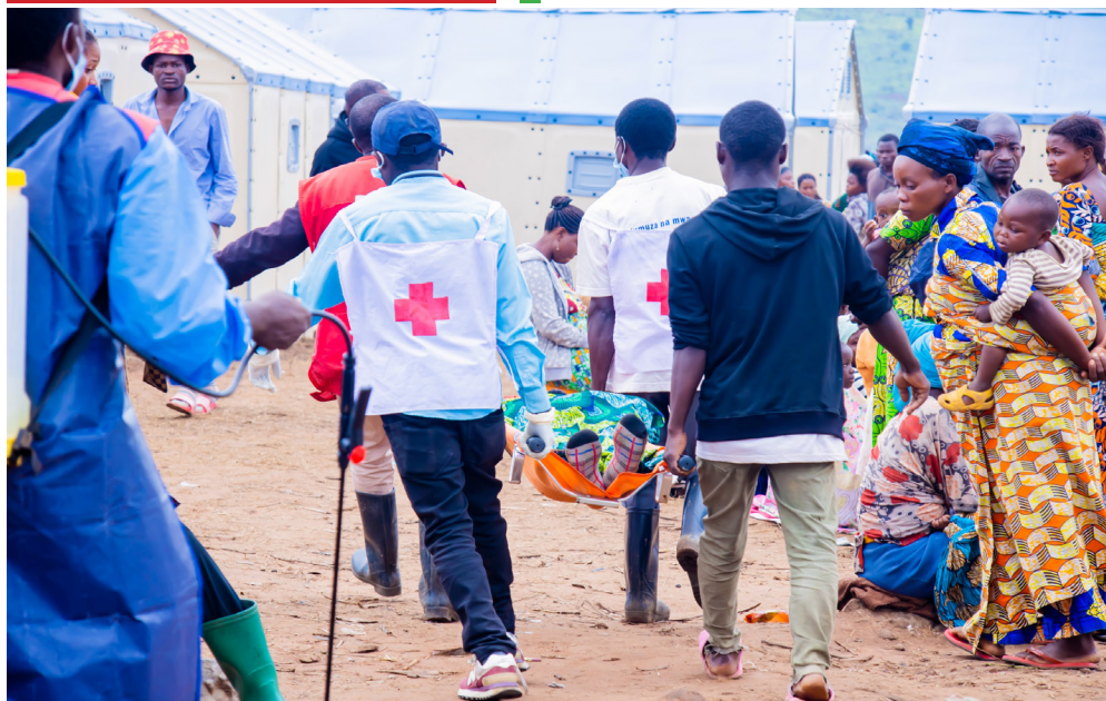
Agents de la Croix Rouge évacuant un malade

Sur le plan sanitaire, les autorités burundaises ont rapidement mobilisé les services de santé pour assurer des consultations médicales, des campagnes de vaccination, la prise en charge des épidémies (en l'occurrence le choléra) et des maladies courantes, ainsi que le suivi des cas les plus vulnérables, notamment les enfants, les femmes enceintes, les personnes âgées et les blessés.