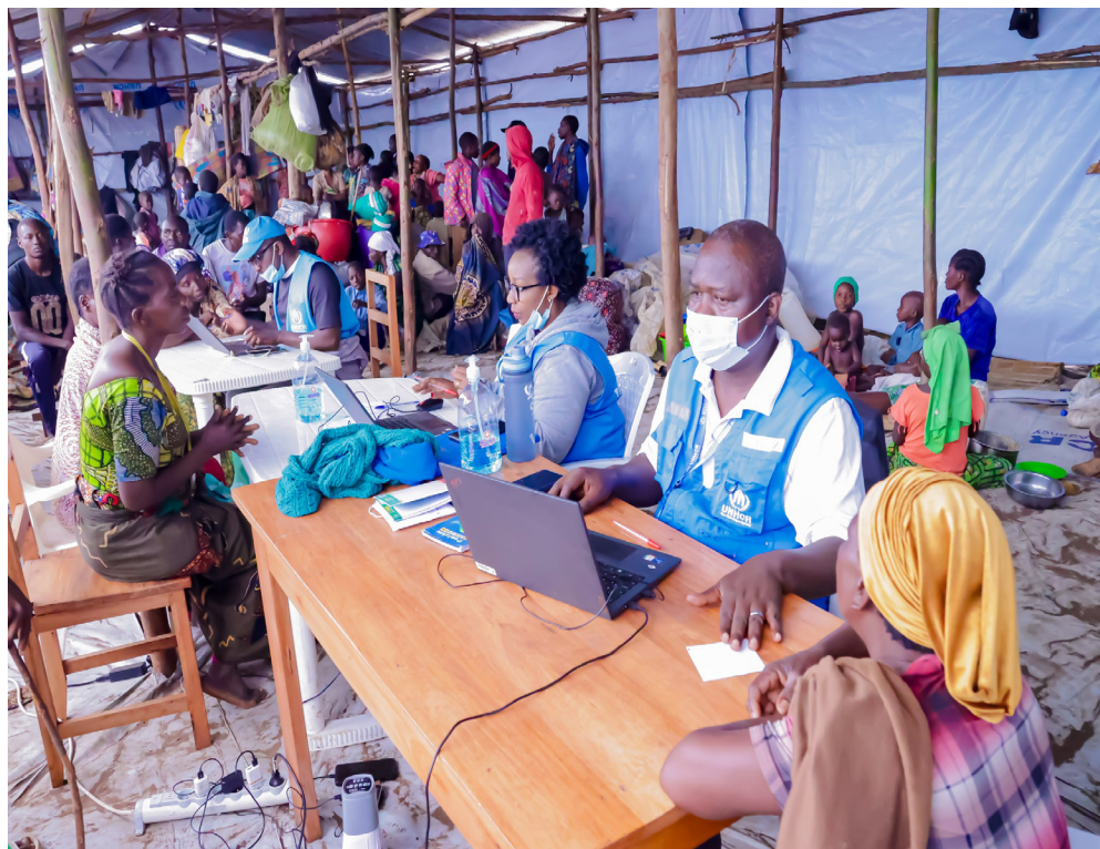
Enregistrement des réfugiés au site de Busuma, en comune Ruyigi

les organisations internationales, les ONG humanitaires et les communautés locales ont uni leurs efforts afin d'apporter une réponse globale, à la fois matérielle, sanitaire, sociale et psychologique.