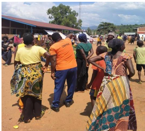
Réfugiés au centre de transit de Cishemere