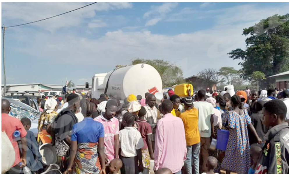
Fourniture d'eau potable aux réfugiés par un camion-citerne de la Protection civile à Gatumba