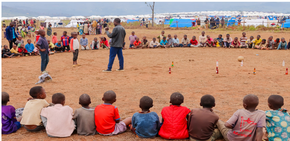
Un agent de l'ONG SAD encadre des enfants réfugiés au site de Busuma

D'autres organisations, telles que SAD, se sont concentrées sur la protection et le bien-être des enfants réfugiés. Consciente des traumatismes psychologiques subis par ces derniers, SAD a organisé des activités ludiques et récréatives dans les camps, notamment des jeux et des moments de divertissement.