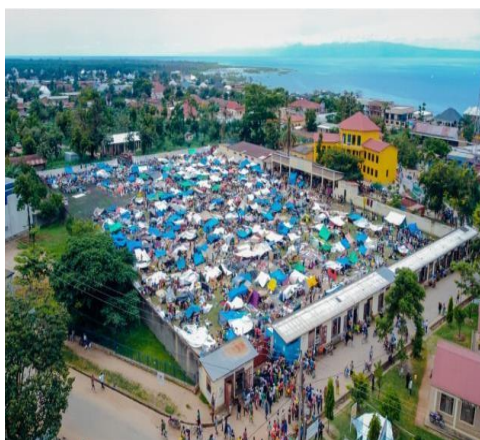
Réfugiés regroupés au Stade de Rumonge