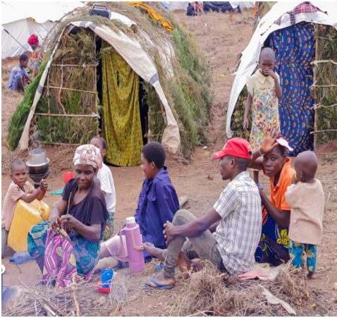
Réfugiés au site de Busuma/Ruyigi

liés aux violences, aux pertes humaines et à l'exil forcé affectent profondément leur bien-être mental et émotionnel, rendant difficile toute perspective de reconstruction rapide.