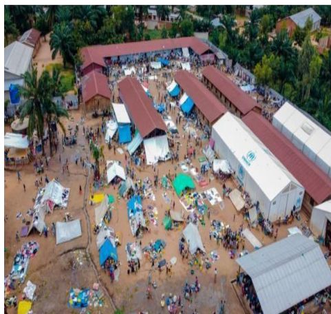
Réfugiés au centre de transit de Makombe