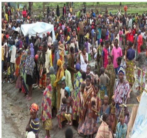
Réfugiés au site de transit de Kansega

des nouveaux sites improvisés ont hébergé des milliers de réfugiés lors de cet afflux. Il s'agit des sites de Gatumba, Vugizo, Magara et Kansega de la province de Bujumbura et de Rumonge de la province Burunga.