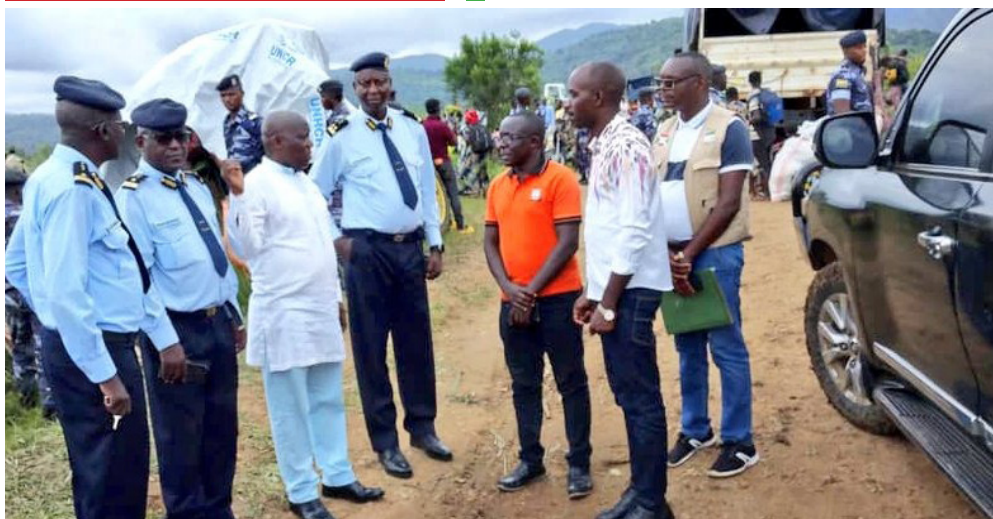
Descente du ministre de l'intérieur auprès des réfugiés au centre de transit de Gatumba